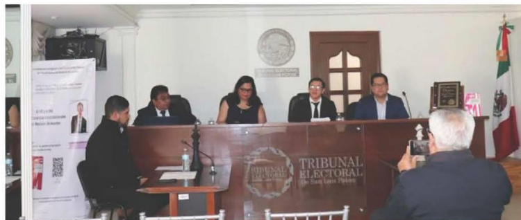
Tribunal Electoral del Estado de San Luis Potosí