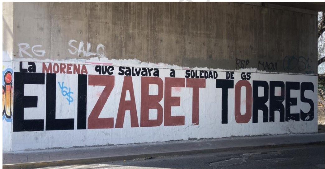
Barda 4. Avenida México en la barda perimetral del Centro Deportivo Ferrocarrilero.

4. En la parte baja del puente vehicular elevado de la Avenida México se localizó una barda de aproximadamente 12 metros de largo por 3 metros de alto pintada con fondo blanco y la leyenda en letras color rojo y negro “LA MORENA QUE SALVARA A SOLEDAD DE GS ELIZABET TORRES” , anexando la siguiente placa fotográfica para mejor referencia: