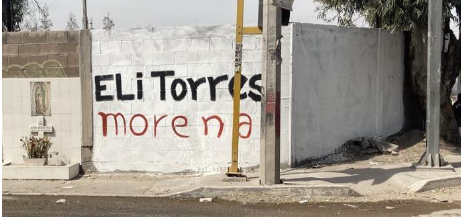
BARDA 1. Calle Melchor Ocampo esquina con Periférico Norte.

La mencionada barda a criterio de este Tribunal, contiene propaganda electoral en la que se hace difusión a la candidata Elizabeth Torres Leija, pues promociona su nombre, conjuntamente con el partido MORENA.