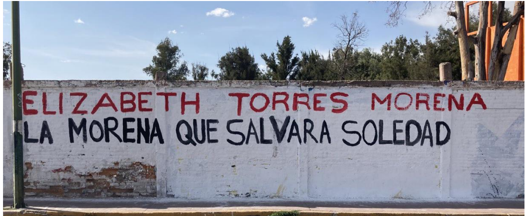
Barda 3. Avenida México en la barda perimetral del Centro Deportivo Ferrocarrilero.

4. En la parte baja del puente vehicular elevado de la Avenida México se localizó una barda de aproximadamente 12 metros de largo por 3 metros de alto pintada con fondo blanco y la leyenda en letras color rojo y negro “LA MORENA QUE SALVARA A SOLEDAD DE GS ELIZABET TORRES” , anexando la siguiente placa fotográfica para mejor referencia: