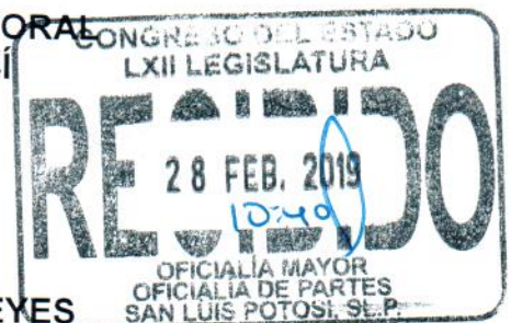
MAGISTRADA YOLANDA PEDROZA REYES

ATENTAMENTE LA PRESIDENTA DEL TRIBUNAL ELECTORAL DEL ESTADO DE SAN LUIS POTOSÍ